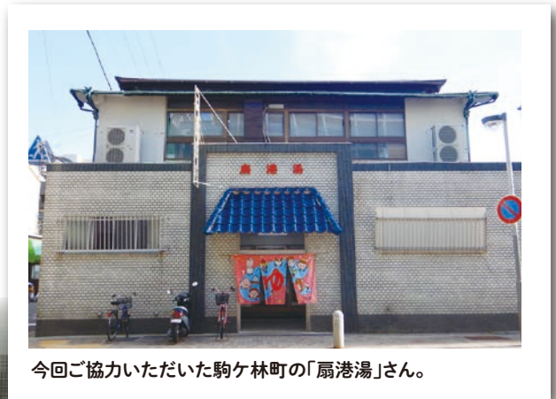
今回協力いただいた駒ヶ林町の「扇港湯」さん。

毎月、区民から寄せられた謎や不思議をさまざまな視点で調査・解明していき、よりディープな長田区の魅力について探っていく、その名も「ながた探偵団」! 「これってなんでこんな形なの?」「近所にあるけどよく知らないなあ」など、素朴な疑問でも長田区内のことなら独自の情報網を使って調査します。