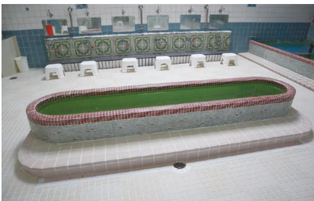
洗い専用浴槽。男湯は青色、女湯は赤色で縁取りされている。

【依頼情報】 近所の銭湯に誰も入っていない浴槽がありますが、あれは何? ぜひ調査してください! (区民Gさん)