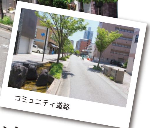
コミュニティ道路