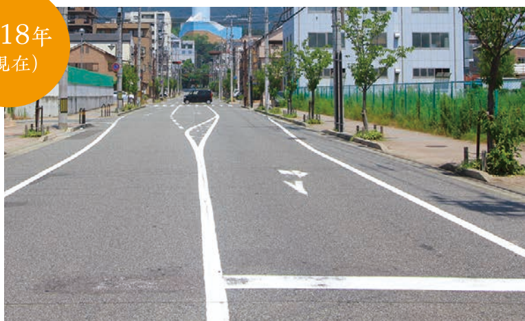
細田町4,5丁目間の道路から北を望む写真。 現在は区画整理により道路の位置や幅が大きく変わり、景観を意識した建物や緑化によって、高取山の山並みと調和した風景となりました。