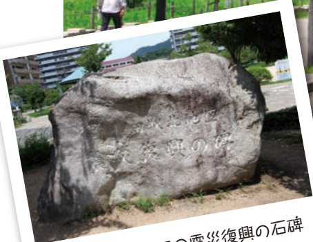
新長田駅北地区の震災復興の石碑