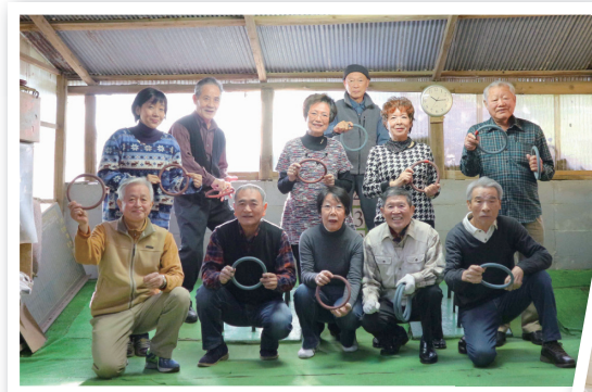
高清算輪会の皆さん