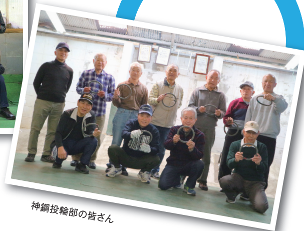
神鋼投輪部の皆さん