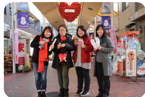
本町筋商店街女子会メンバーの皆さん

新長田合同庁舎の完成に向けて、新長田の商店街でも盛り上がりを見せていこうとさまざまな取り組みが始まっています。2月末金曜日のプレミアムフライデーでは、新長田の商店街で楽しいワークショップが開催される予定です。プレミアムフライデーを拡大し、1週間ワークショップを開催予定の本町筋商店街女子会メンバーの皆さんに新長田合同庁舎について聞いてみました。「合同庁舎の完成に向け、足を運んでもらえる商店街にしていきたいとみんなで頑張っています!コサージュ作りやDIYなど女性を対象にしたワークショップを開催します。早めに仕事を切り上げて商店街で夕方のひとときを楽しんでもらえれば」。