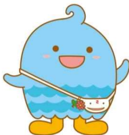
左右反転して利用