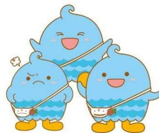
キャラクターを重ねて利用