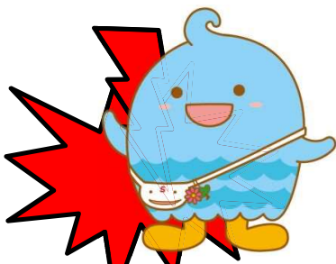
キャラクターと調和しない背景や色、持ち物と併せて利用