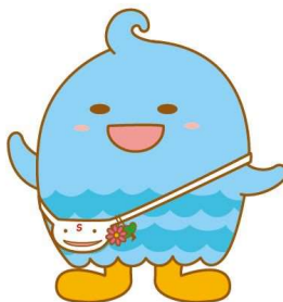
表情など細部を部分的に変更して利用