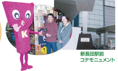
新長田駅前 コテモニュメント

こなもんを食べる道具の名称は「コテ」「テコ」「ヘラ」「かえし」色々あるが、新長田では「コテ」を推している(「テコ派」の皆さんすみません)。コテに因んだシンボルやキャラクターも多数存在する。新長田駅前広場には巨大コテモニュメント(新長田のシンボル、身長18メートルの鉄人28号モニュメントがお好み焼きを食べるときに使うサイズ設定)。ド派手なピンク色をした、ご当地ゆるキャラ『コテリン』は何と顔出しシステムで新長田のよもやま話をお喋りするというから驚き。新長田のご当地ソングを歌う真っ赤な衣装がトレードマークの歌手は「鉄板コテ之介」。いつもかぶっている帽子には【命】と書かれたコテが突き刺さっている。鉄板コテ之介が歌うご当地ソングは、歌詞を読むだけで、長田の熱いこなもん愛をしっかりと味わうことが出来る。