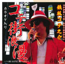
謎のシンガー 鉄板コテ之介

焼き上がりが待たせられない ビールの泡で時間をつぶす 目の前に焼きあがった1枚 ソースふんだんに塗り終え 私はコテをだまってる握る 夢のような幸せの瞬間 ほおげる喜び、コテの街 コテの街新長田