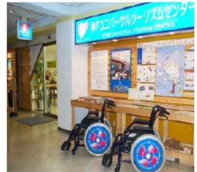
神戸ユニバーサルツーリズムセンターの外観

旅行に行って安心安全に滞在・旅できる街は、そこは住みたいと思えるような街。2020年オリンピックパラリンピックを契機に、自由に旅ができる環境、たくさんの笑顔に出会える機会がさらに増えていくことで、神戸誘客、移住を希望される方が増えていくことを願っています。