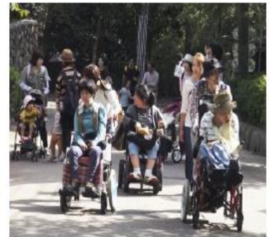
王子動物園での撮影の様子