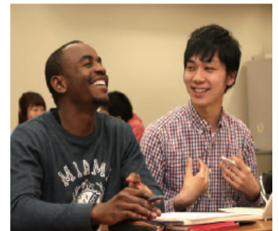
日本語教室だんらんの様子