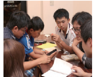
放課後学びスペースアシストの様子

当NPOは、「学びの主体性と協調性」に重点を置いています。活動には多くの大学生が関わり、「学び合い」を実践しています。大学、企業、地域団体など、主体的に学び、協力して物事を成し遂げる人材の育成に関心がございましたらお気軽にmanabitojimukyoku@gmail.comまでお問合せ下さい。