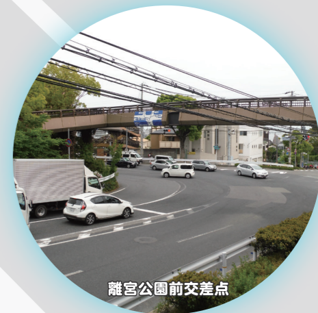
離宮公園前交差点