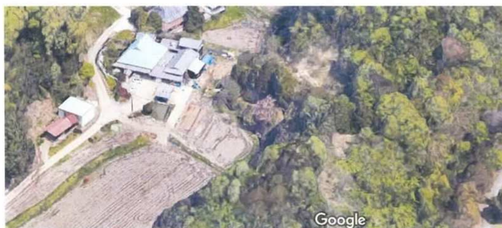
"Map data ©2020 Google"