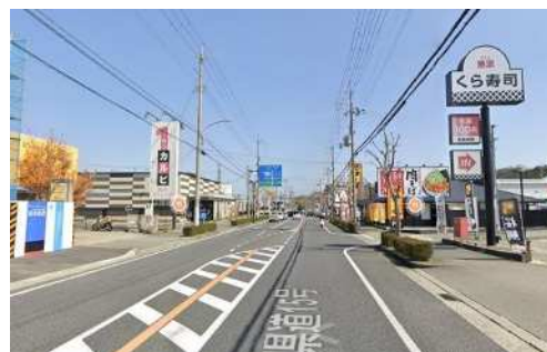
↑ 県道 15 号線(通称 有馬街道)