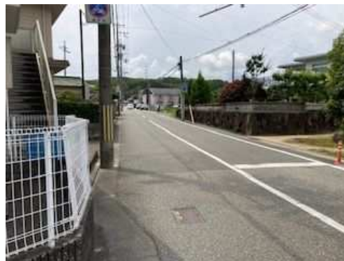
↑ 田尾寺交差点から西側を撮影 2021.6.30