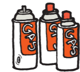
カセットコンロ用 ボンベ

中身の残ったスプレー缶やカセットコンロ用ボンベが燃えるごみや燃えないごみなどに混ぜてしまうと、爆発や火災の危険性があるため収集できません。