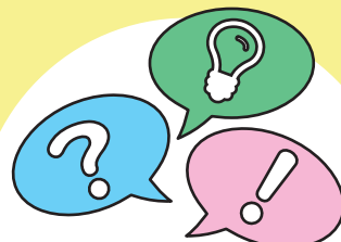
自治会役員・メンバー研修