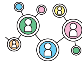
NPO等連携・マッチング