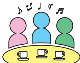
地域のサロン・交流会